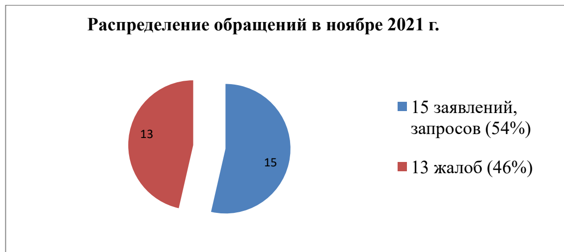
Распределение обращений в ноябре 2021 г.

В числе 28 обращений поступили 15 заявлений и 13 жалоб: